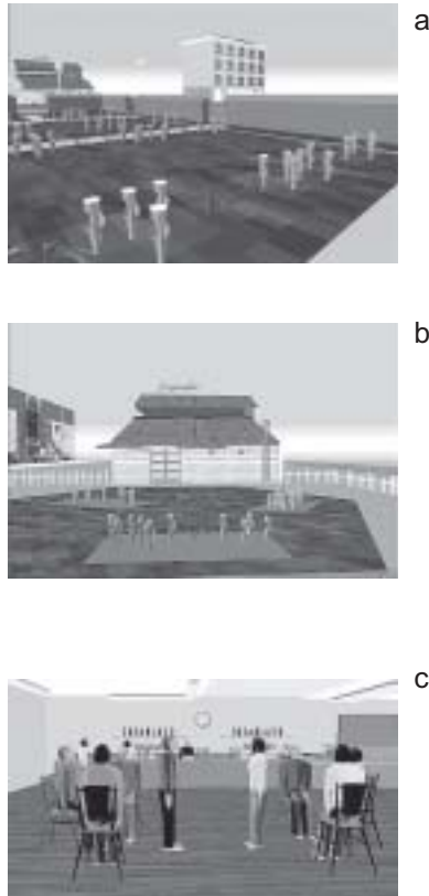
Figura 3: (a) punto de inicio; (b) acercándose al café; (c) acercándose al mostrador

La mayoría de los participantes con TEA se comportaron de una manera similar al grupo de comparación no autista, tratando el EV como un juego en la mayoría de las situaciones. Es decir, a menudo caminaban entre las dos personas virtuales cuando iban hacia el mostrador del café virtual. Sin embargo, las personas del grupo con TEA eran menos proclives que los estudiantes de los grupos de control a admitir que esta conducta era socialmente inaceptable. Asimismo, los estudiantes con TEA eran más proclives a atravesar el jardín del vecino en comparación con el grupo correspondiente de CIP, y un tercio del grupo con TEA (4 de los 12) mostraba una conducta que ‘no guardaba relación con la tarea’. Entre otras, se paseaban por el café, incluso detrás del mostrador, y navegaban hasta otras personas de la escena. Esta conducta es propia de estudiantes con un CIV bajo y habilidades ejecutivas