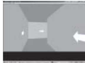
Figura 2 (b) Corredor del entorno de formación