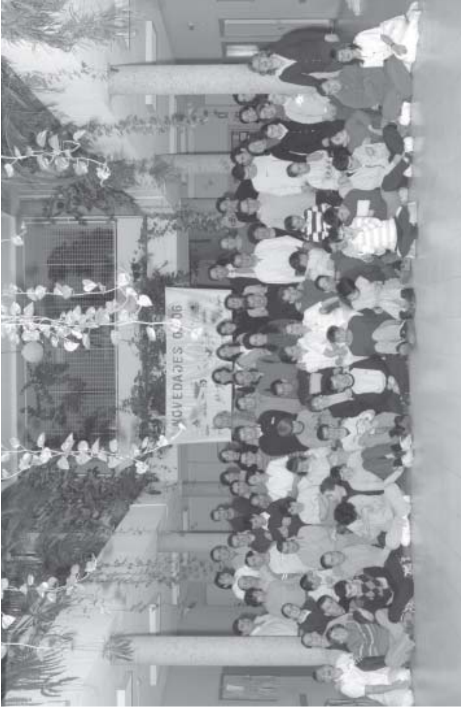
Personas con autismo y profesionales del Centro Nuevo Horizonte, en su XXV aniversario